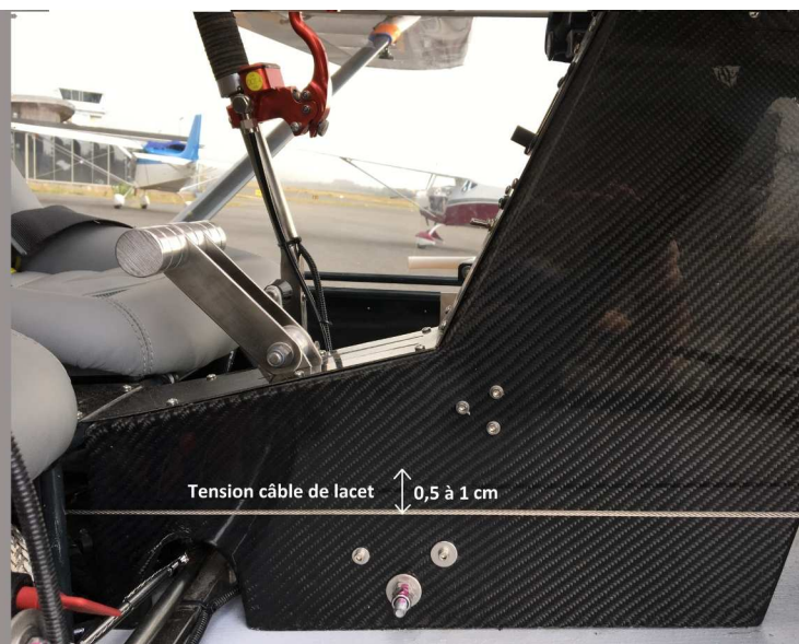
Tension câble de lacet (2)