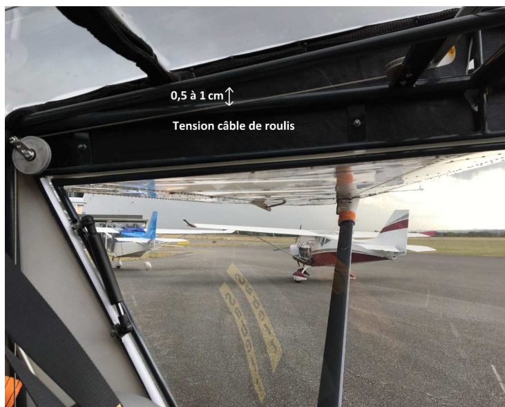
Tension câble de roulis (1)